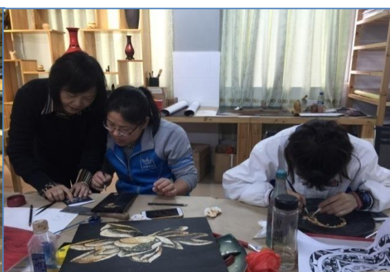
阳江市漆艺协会来校园漆艺工作室