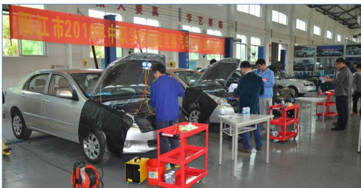
阳江市中等职业学校技能竞赛现场

(3) 利用竞赛和教学搭建信息化教学资源库；竞赛与研发机制促进师资水平大幅度提升；项目课程与赛项模块课程、企业课程融合贯穿在专业学习中，促使各专业实现技能大赛与课堂教学、实践教学紧密结合，推动了专业教学模式和人才培养模式的改革。