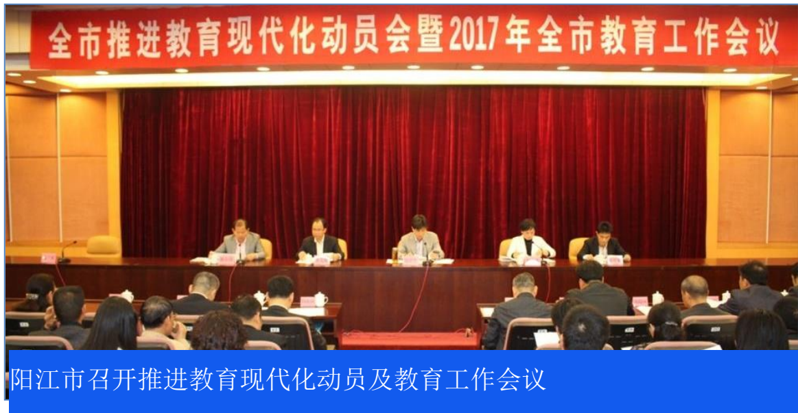
阳江市召开推进教育现代化动员及教育工作会议

市教育局、市发改委、市人社局、市财政局、市编办等部门各负其责，认真履行推进职业教育改革与发展职责，共同促进全市职业教育各项政策、措施的落实；各县区教育局从国家发展职业教育的大局出发，按照区域内普职招生比例大体相当的要求切实加大统筹力度，制定招生工作政策。