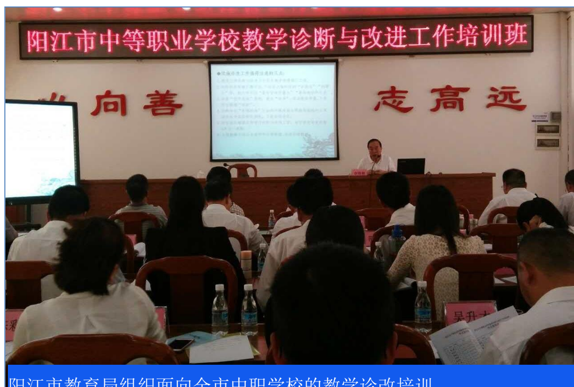
阳江市教育局组织面向全市中职学校的教学诊改培训

研究专家、行业企业专家等参与到“阳江市中职学校教学工作诊断与改进专家委员会”；组织召开全市中职学校教学工作诊改推进会。