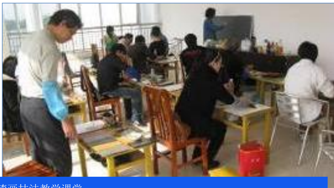
漆画技法教学课堂

除了让民间工艺美术大师走入课堂，我们还组织师生参观阳江漆艺学院漆器作品的生产和创作过程，了解阳江漆器艺术的起源和现状，切实做好阳江漆艺文化的“教育传承”。阳江一职与阳江市美术家协会一起，将阳江漆艺文化艺术带入校园，做好文化传承中的“教育传承”。