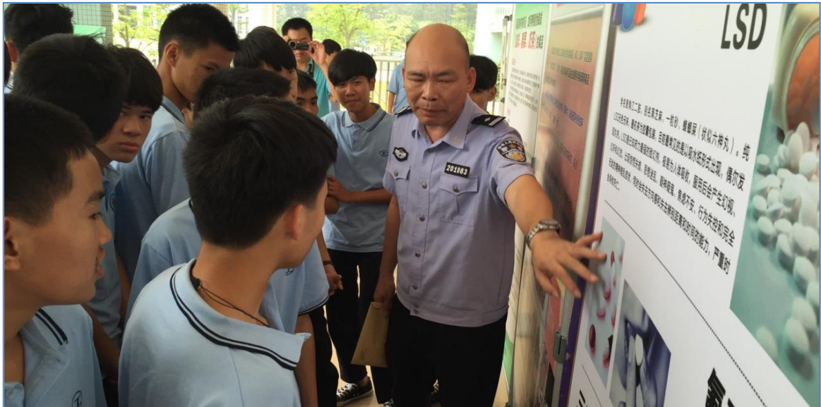
“6·26”国际禁毒日禁毒宣传教育活动进阳江一职校