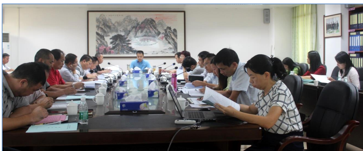
阳江一职校长带领全体中层干部学习教学诊改方案 部署诊改工作

四是根据通知编制了《2016 年度阳江市第一职业技术学校年度质量报告》和《2017 年度阳江市第一职业技术学校年度质量报告》。