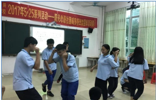
阳江市中职学校阳光心语社团活动