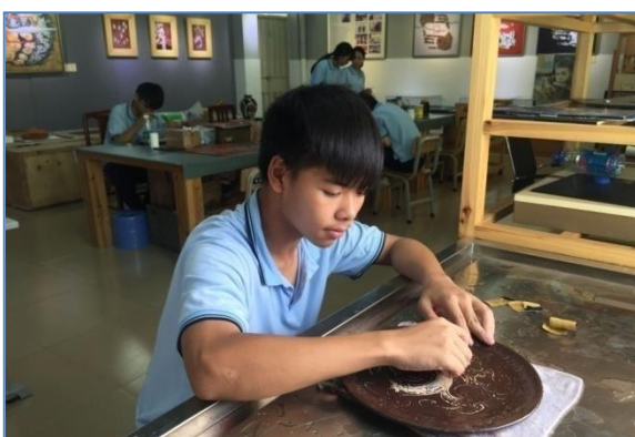
学生在校园漆艺室做漆盘