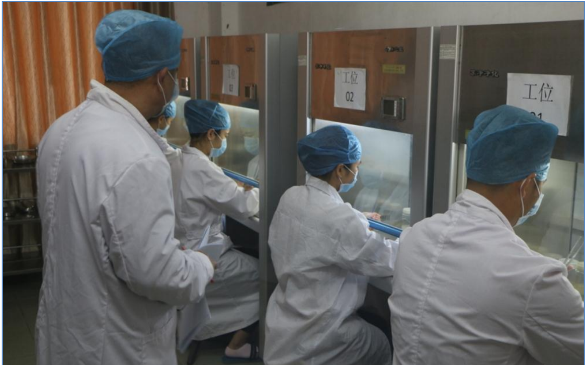
阳江市中等职业技术学校技能竞赛现场

【案例分享 10】 阳春市中等职业技术学校学生参加第十三届全国中等职业学校“文明风采”广东省复赛共 70 人次，其中，58 次获得第十二届全国中等职业学校“文明风采”优秀奖；2 人在凤凰之星·2016 广东省少儿才艺大赛绘画类少年组获奖；在第十三届全国中等职业学校“文明风采”竞赛广东省复赛及全国决赛中，团委选送的作品中，获得一等奖作品 8 个，二等奖作品 16 个，三等奖作品 34 个，1 个项目获得了全国总决赛优秀奖；4 人在广东省第六届创意机器人大赛上获得奖项；承办了广东省第八届“瑞派·华南兽医杯”比赛并获得了 1 个一等奖 1 个二等奖的好成绩；第九届阳江市青少年科技创新大赛中，阳春中职 2 个作品获得一等奖、3 个作品获得三等奖；在第二届阳江市机器人大赛暨广东省创意机器人大赛阳江市预选赛中，一等奖 9 名，占全市高中组的 45%，二等奖 6 名，占全市高中组的 22%，阳春中职获得“最佳组织”奖。