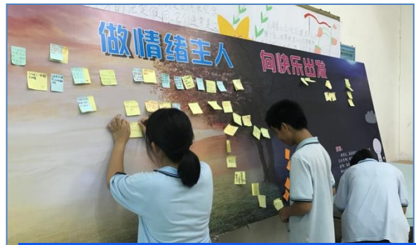
阳江市中职学校情绪管理主题班会

【案例分享 1】 阳江市第一职业技术学校代表广东省七所中职校之一，以“阳江漆器髹饰技艺”为传承项目，入选了“全国中小学中华优秀传统文化传承学校”。该校将传播博大精深的中国工匠文化，弘扬追求卓越的中国工匠精神，继承高超精湛的中国技艺，造就高新技能人才，做为提升学校内涵、提高学生职业技能的主旋律。通过以“弘扬工匠精神，启动梦想之航”的系列主题活动，向社会全面展示了该校职业技能发展所取得的成果。