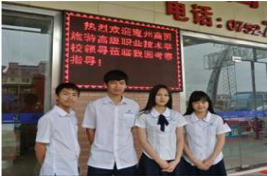
市场——学生到中粤通物流园进行调研

检验学生对实际问题的分析和解决能力。物流服务与管理专业通过市场、职场、赛场——“三场联动”的模式，使学生具备坚实稳固的学习基础能力，满足职业发展的职业扩展能力和分析解决问题的专业核心能力，成为现代物流职业人。