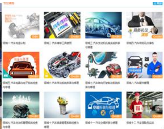
基于 KTS 平台的混合式教学