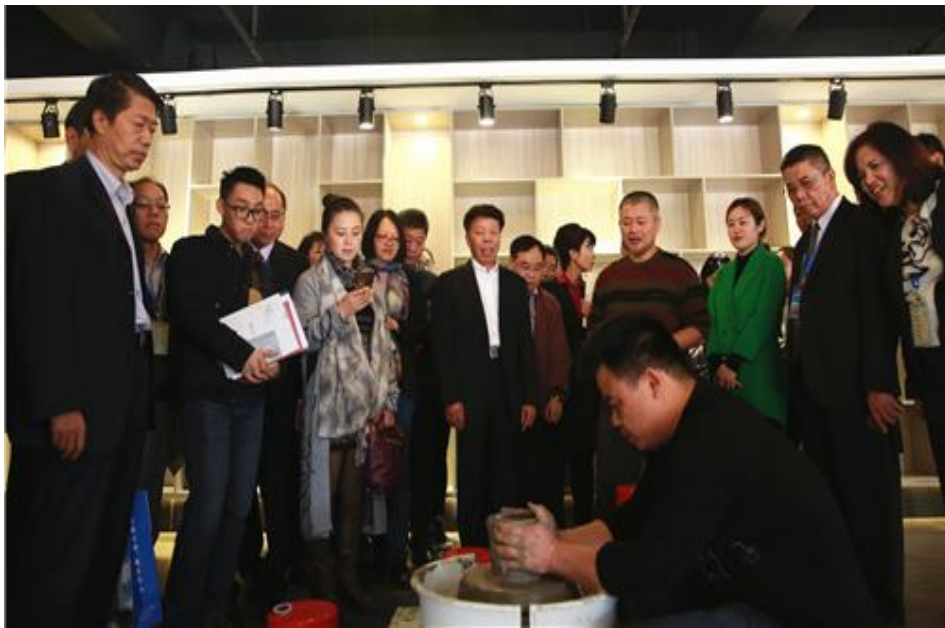
国职业院校代表参观文化小镇