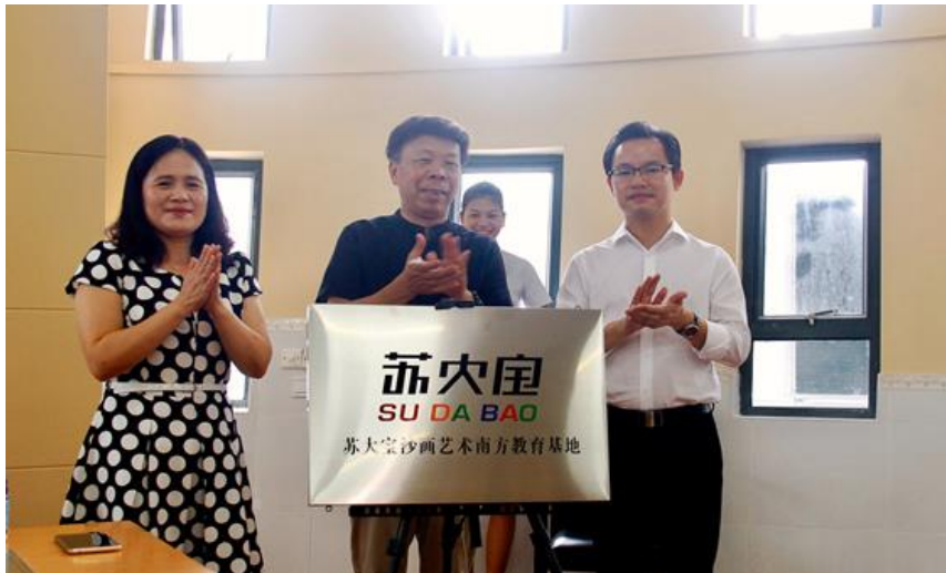
苏大宝沙画艺术南方教育基地在学校揭牌