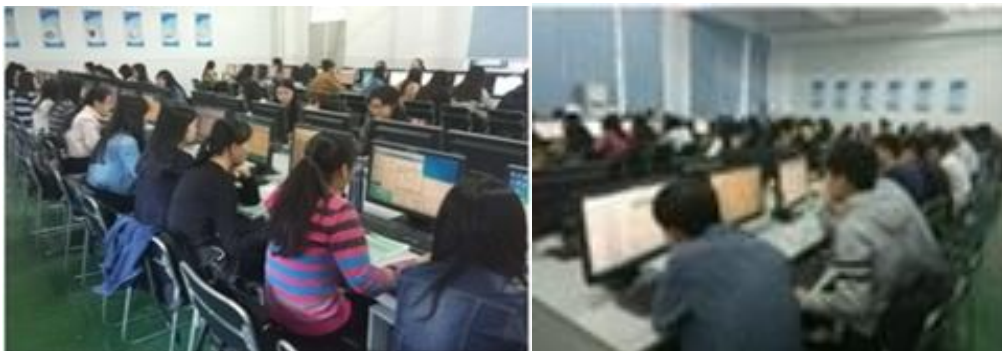
教学实战型会计岗位模拟教学法