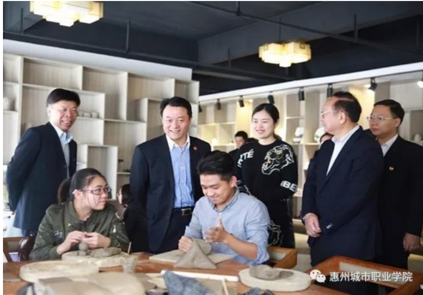
团中央书记处书记傅振邦观摩学生泥塑艺术课