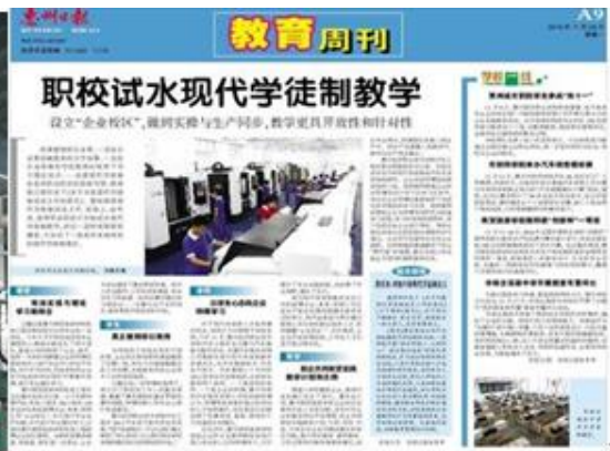
企业校区实训基地