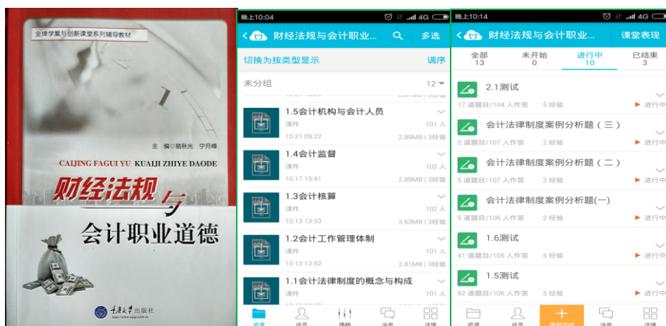
校本导学案和蓝墨云班课教学

会计系利用翻转课堂，结合会计工作纪律和会计资格考试的要求，组成《财经法规与会计职业道德》教学改革实践研究课题组，编写了校本特色的《财经法规与会计职业道德》导学案，由重庆大学出版社公开出版。使导学案、蓝墨云、微信二维码、课堂教学完美结合。该课题获校本课题二等奖；并获中国职教学会教学/教材工作委员会2015-2016年度课题二等奖。为翻转课堂提供介质支持，让学生真正成为学习的主体。