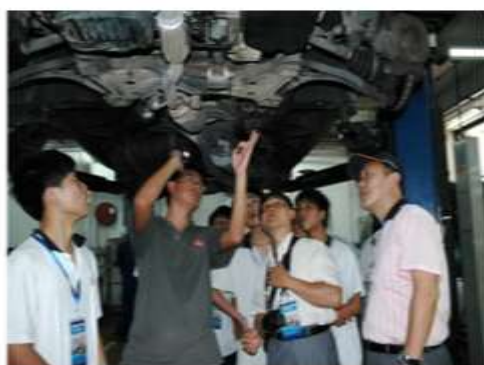
赴港见习师生在森那美公司观摩 汽修专家的汽车底盘维修演示

通过开展肇港职业教育学习与交流,学校及时找差距、补不足、改革创新,推动了学校汽修专业发展向国际化方向靠拢。学校更加重视学生的实操教学,投入了大量资金,引进了先进的检测线等设备。汽修专业在课程设置、教材选择、教学方法、教学管理、行业信息技术和推荐就业等方面适时进行了理念引进和更新,探索出一条真正符合学校实际的职教合作之路,着力培养与国际接轨的高级汽修职业人才。