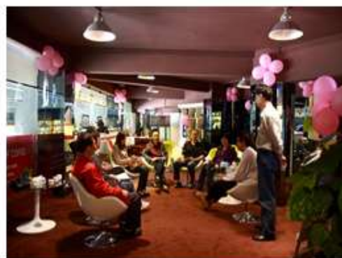
与飞露士汽车美容有限公司负责人座谈