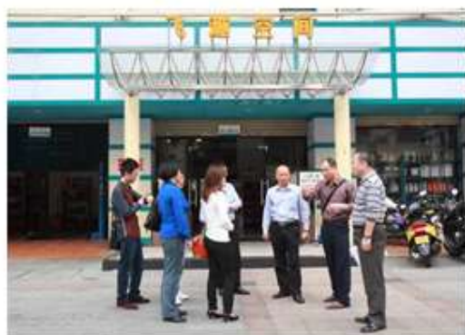
与飞越空间贸易有限公司主管交流

建设与企业岗位职能相对应的独立教学体系，进行了“人才培养模式改革的企业调查报告”，开展了一系列的深入企业调查研究工作。通过深入汽车维修现场与企业经理、一线的维修工、技术总监座谈、与顶岗实习的学生座谈、深入汽车维修现场进行问卷调查、邀请行业专家专题研讨和通过上网了解国家示范汽车检测与维修职业高职院校的建设及调研资料。