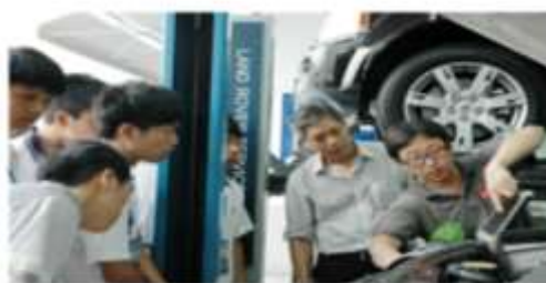
赴港见习的汽修专业师生在森那美公司认真观摩汽修专家的检测演示

(3) 建设与企业岗位职能相对应的独立教学体系，培养适应一线汽车维修、车身修复、汽车营销等方面的应用型人才。