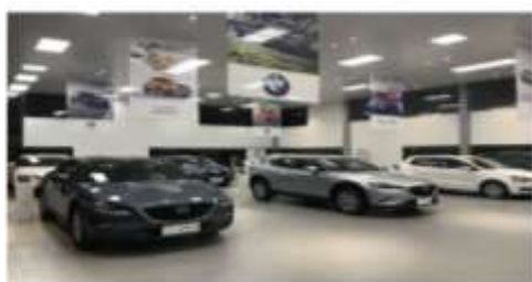
校内校企共建汽车营销中心

(2) 在教学模式上实现了“从教室到车间”的转变。将汽修专业课程教学由教室搬到车间，由原来的理论、实习教师分开上课变为直接在车间教学，加强了实践总结和经验提炼，形成了“小模块、一体化、项目任务主导式”人才培养模式。重新整合各类教学资源，将理论与实践教学融为一体，着重体现培养学生动手能力为中心的特点。通过内容选择、模块设计、教学方法改革和创新、评价方法改革创新，更好地体现了提炼关键技能以形成典型技能、理论与实践的有机结合等鲜明特征。并完成了人才培养模式实施方案，构建了课程体系，修订了教学计划和教学实施成效评价等方案，加强了学生实训实习环节的学习。