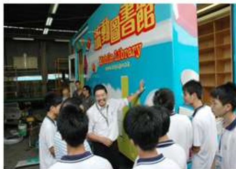
赴港实习的我校汽修专业师生在听取森那美汽车服务有限公司专家讲解汽车改装的流程