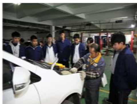
学生在校内校企共建汽修车间实训